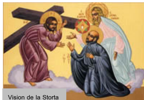
Vision de la Storta

L'identité est à la base de tout discernement : nous devons nous demander continuellement qui nous sommes : des créatures faibles et fragiles, appelées à servir. L'identité des jésuites se trouve dans 'La Storta', cette expérience spirituelle unique d'Ignace que Dieu le Père a placé avec son Fils ressuscité portant sa croix, et le Fils le prend comme serviteur. « Les jésuites savent qui ils sont en Le regardant » (Décret 2,2). De même, toute personne faisant partie de la famille ignatienne, retrouve son identité dans 'La Storta'.